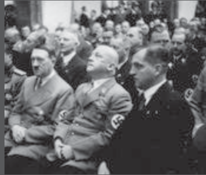
Hitler, Adolf Wagner, August von Finck

zu einem Haus der Deutschen Kunst, zum neuen Glaspalast, soll dies eine Wendung bedeuten für die Stellung des Künstlers zu seinem Volk. In einer neuen Gemeinschaft solle und werde er wieder Kündler deutscher Form, deutscher Innerlichkeit und deutscher Größe, Mittler eines neuen Geisteslebens und damit Willensträger im Kampf für das Bestehen und Wachsen der Nation. Dann soll dieses Haus eine Heimstätte sein den deutschen Meistern, ein Hort der deutschen Kunst. Heil Deutschland! Heil unserem Führer!“