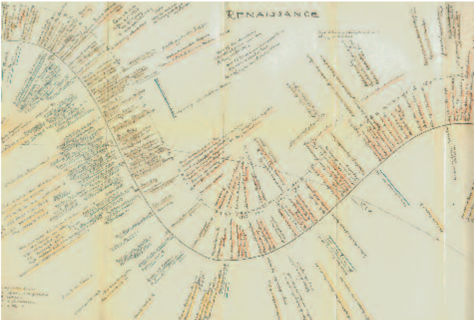
Abb. 11: K. Baur, Renaissance (Ausschnitt) (Baur 1968, Falttafel)

men seiner Zyklentheorie sowie Ligetis Verleger Karl Baur (Abb. 11) Arbeiten vor, die den Weg weitergingen.